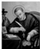
San Alfonso María de Liguorio

Las Glorias de María es un libro escrito por San Alfonso María de Liguorio. Con Oraciones a María, Reflexiones y Meditaciones sobre la Virgen María. Completísima obra sobre la Santísima Virgen María, quizá de las mejores escritas hasta ahora. Trata sobre la vida de la Virgen, sus gracias, sus virtudes, etc. Se aborda también el importantísimo tema, entre muchos otros, del poder de intercesión de Nuestra Señora y de cuán bueno es acudir a Ella.