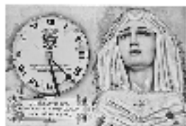
Reloj de sobremesa de 12 cm. con Virgen María.