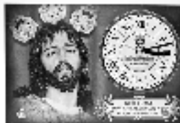
Fig. de San Juan de los Rios.